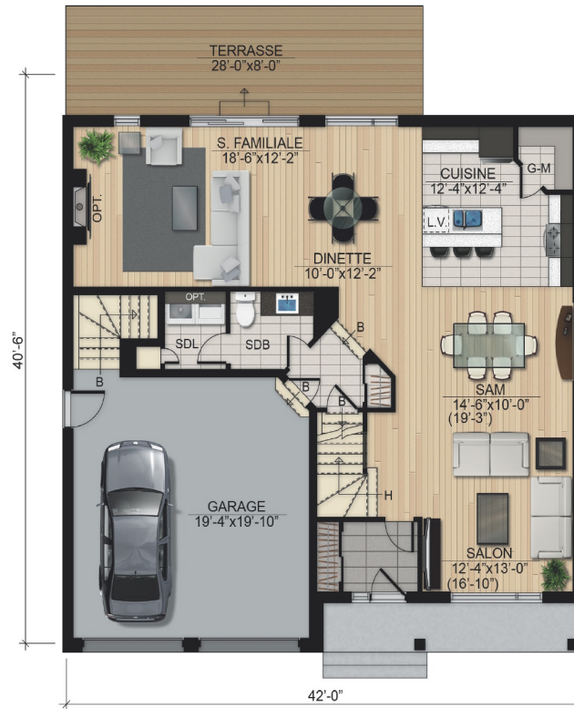
Rez-de-chaussée 1173 pc