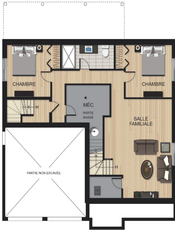
Conception du sous-sol en option