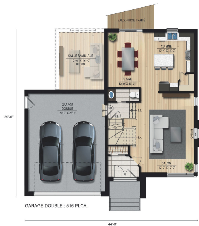
REZ-DE-CHAUSSÉE 833 PI.CA.