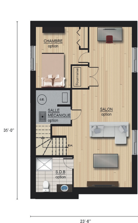
Conception du sous-sol en option SOUS-SOL